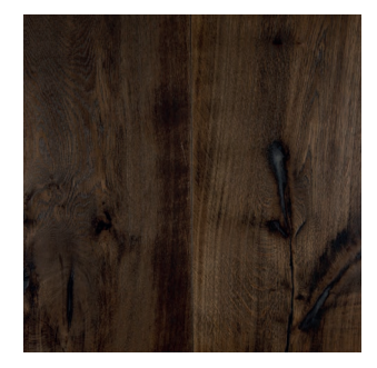
Eiche 1900 dunkel