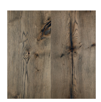
Eiche 1900 hell