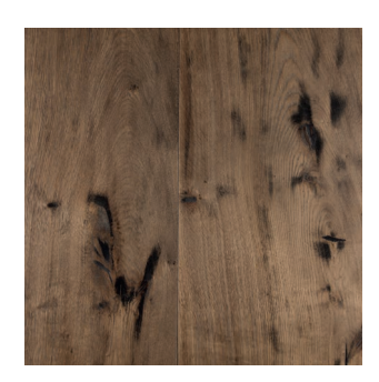
Eiche 1900 mittel